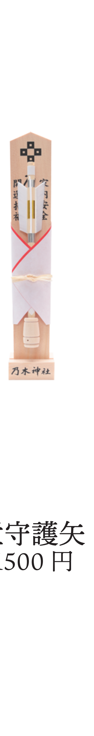
置守護矢 1500 円