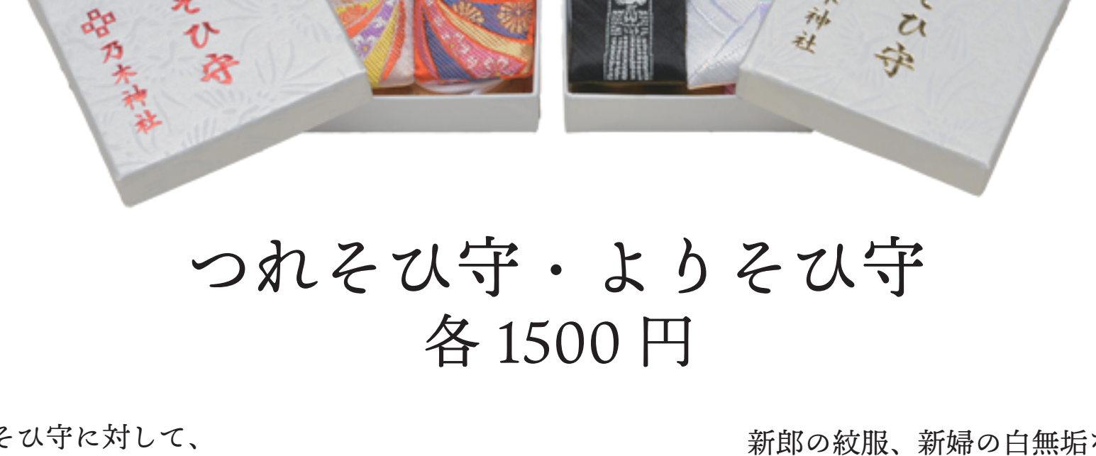
つれそひ守・よりそひ守 各 1500 円

よりそひ守に対して、 結婚より年月を積み重ねられたお二人に、 これからも長く「つれそって」いけますようにと 願いを込めた御守です。 絵柄のように強い結びつきで 末永くお二人がつれそえるよう 願いを込めております。