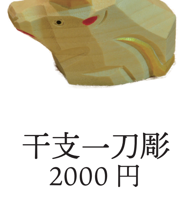
干支一刀彫 2000 円