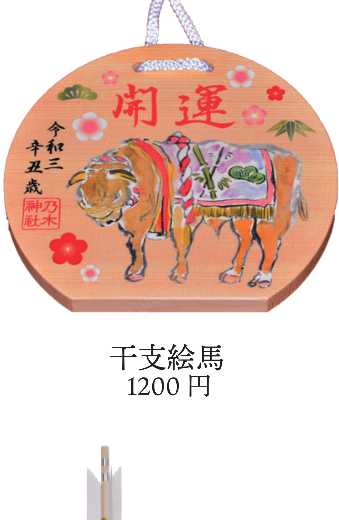
干支絵馬 1200 円