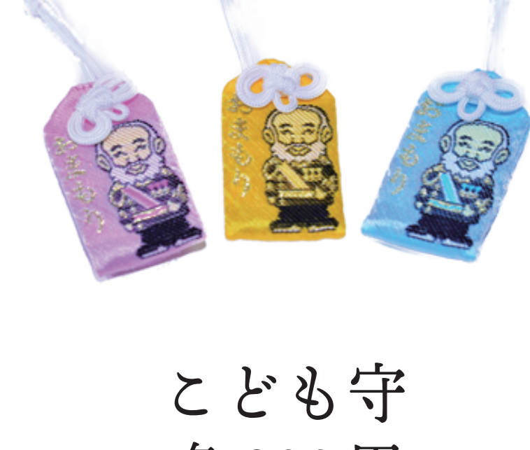
こども守 各 800 円

古来より梅の花の強い香りは 邪気を祓うとされてきました。 新春限定で鳩居堂謹製の馨しい 梅のお香を詰めた梅香守を頒布しております。