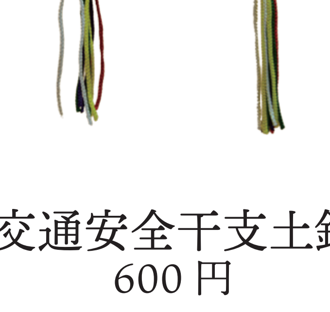
交通安全干支土鈴 600 円