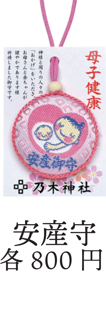
安産守 各 800 円