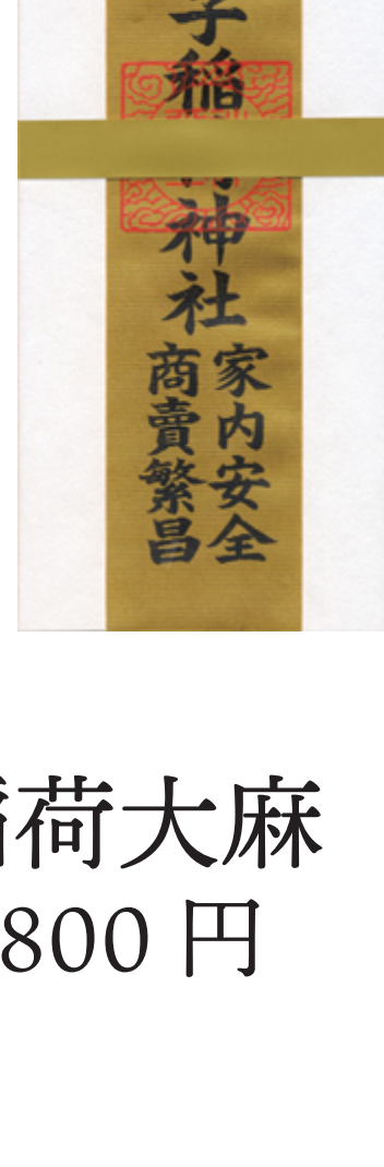
稲荷大麻 800 円