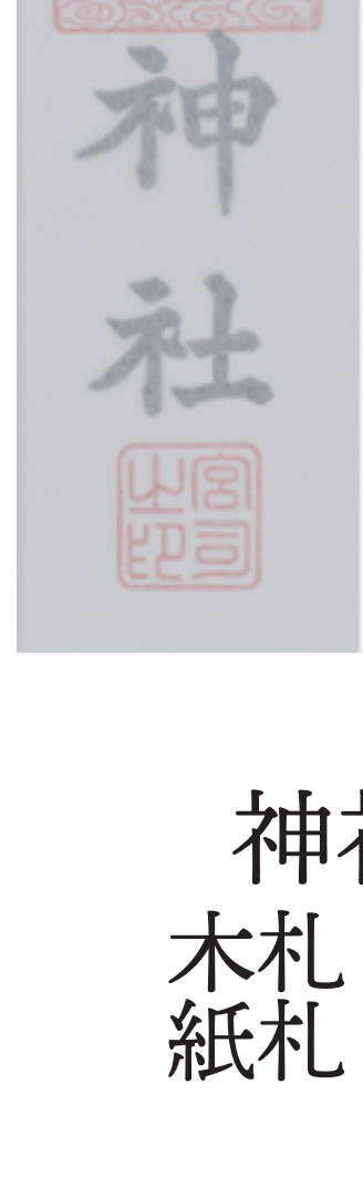
神社大麻 木札 2000 円 紙札 800 円