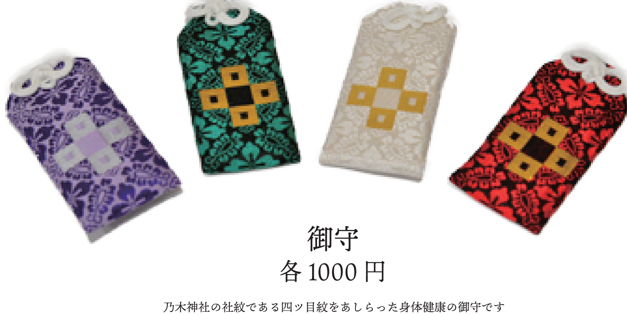
御守 各 1000 円