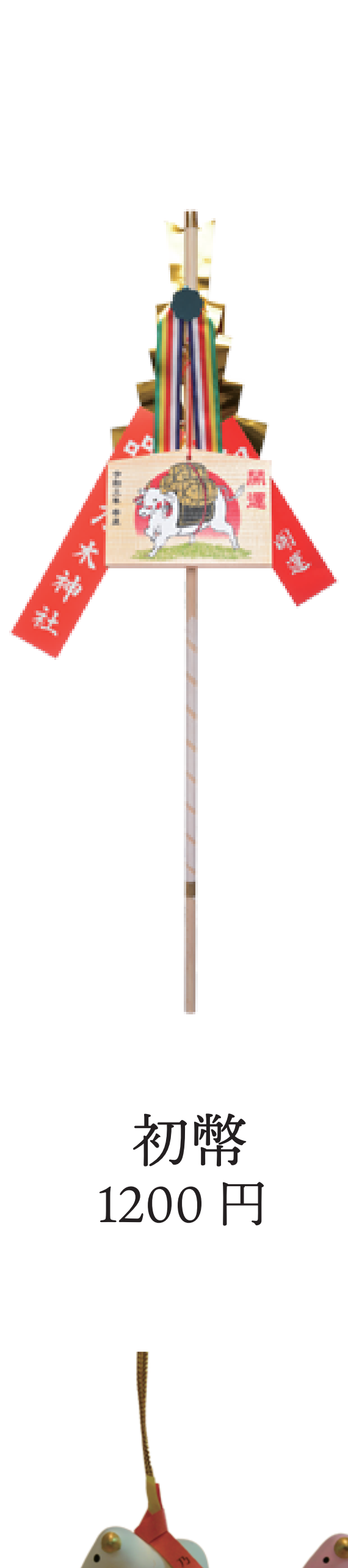
初幣 1200 円