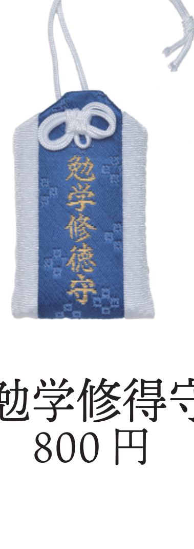
勉学修得守 800 円