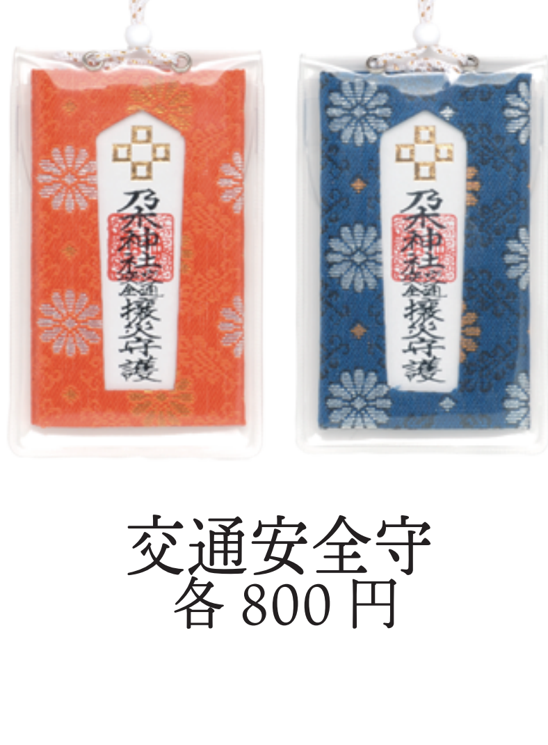
交通安全守 各 800 円