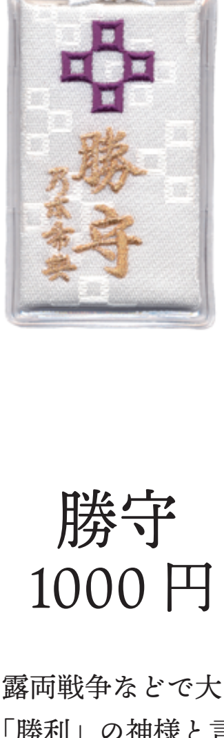
勝守 1000 円

新郎の紋服、新婦の白無垢をあしらひ、 夫婦となる 2 人が末永くよりそって 幸せにお過ごしいただくようにと 願いを込めた御守です。