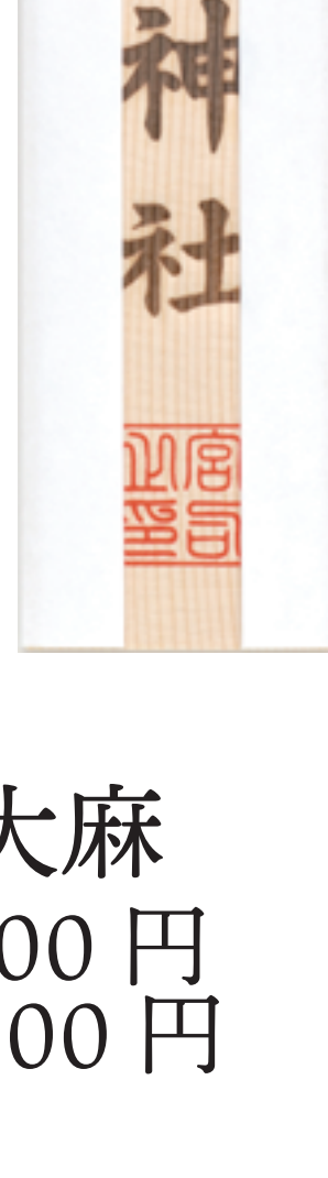
神宮大麻 1000 円