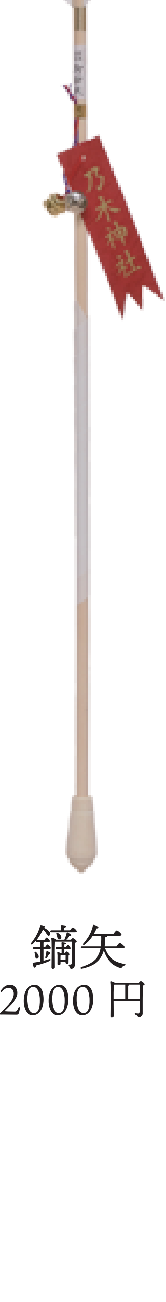
鏑矢 2000 円