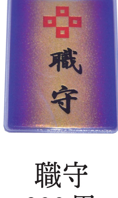
職守 800 円